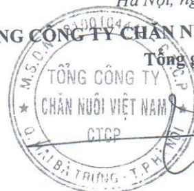
Bùi Đức Hoàn

(Các thuyết minh từ trang 10 đến trang 33 là bộ phận hợp thành của Báo cáo tài chính tổng hợp này.)